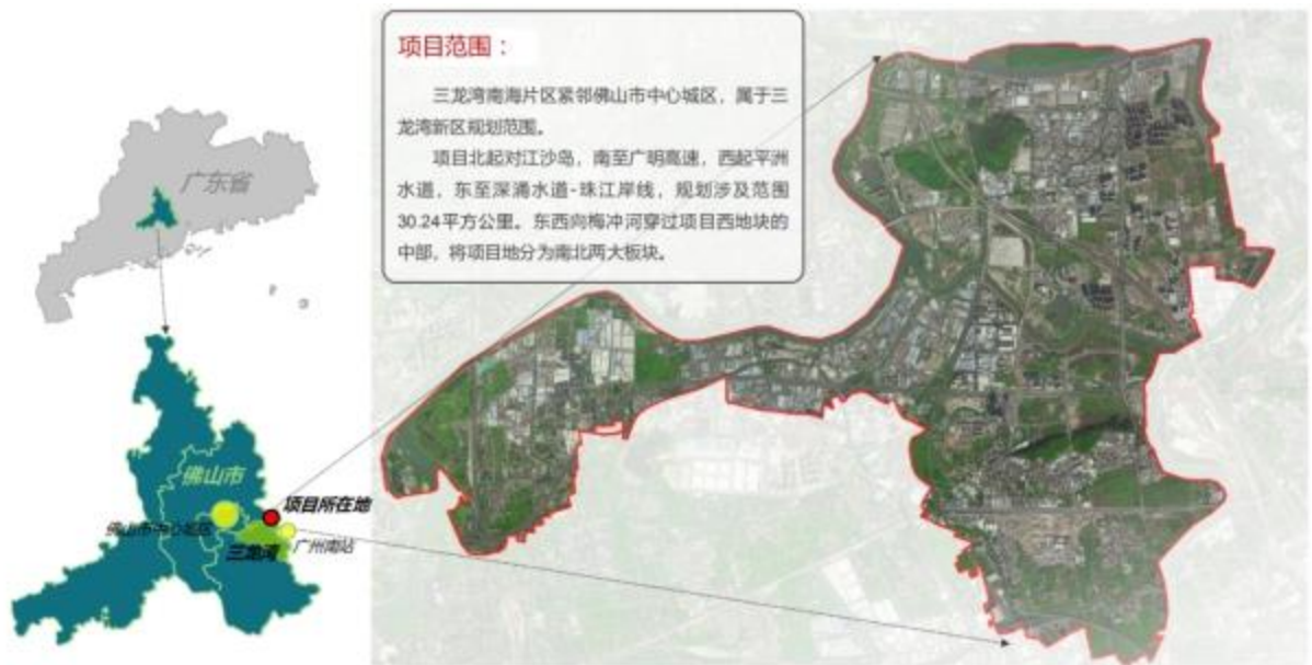
规划研究范围示意图

本次规划研究区域为佛山市三龙湾高端创新集聚核心区的南海片区，规划研究范围总面积约为 30.24 平方公里。