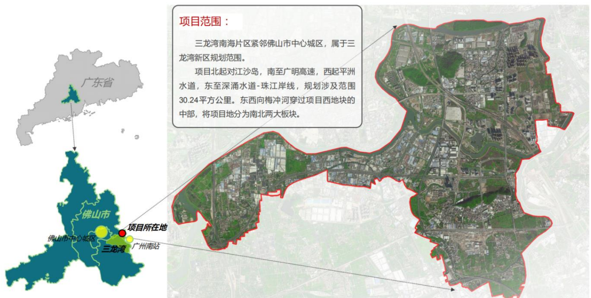
规划研究范围示意图

本次规划研究区域为佛山市三龙湾高端创新集聚核心区的南海片区，规划研究范围总面积约为 30.24 平方公里。